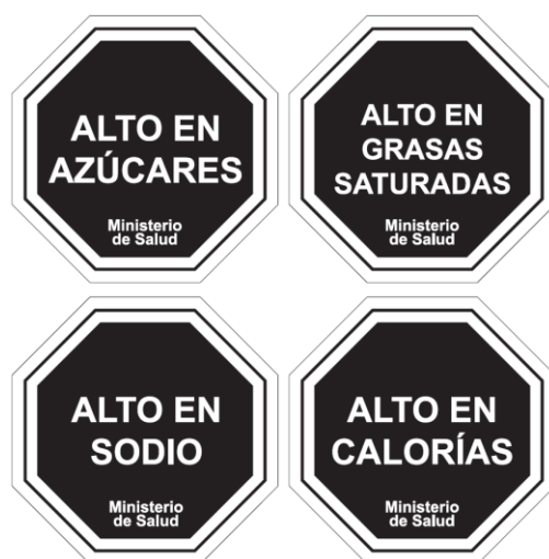
Diagrama N° 1

Las características gráficas de los descriptores nutricionales señalados en el Diagrama N°1 serán las siguientes: