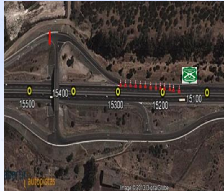
ZONA 5: Atraveso Lo Aguirre