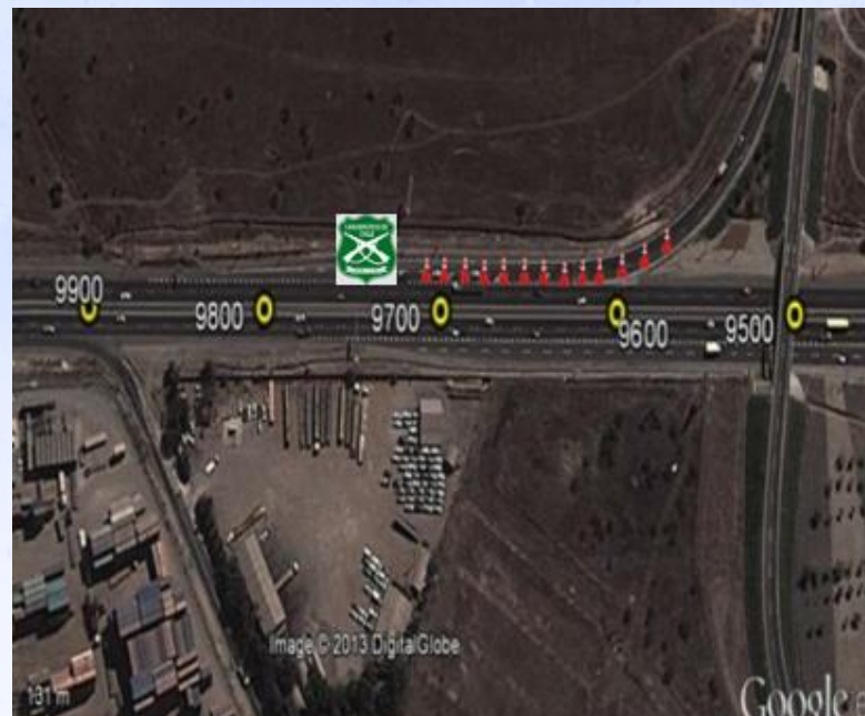
ZONA 2: Enlace Costanera