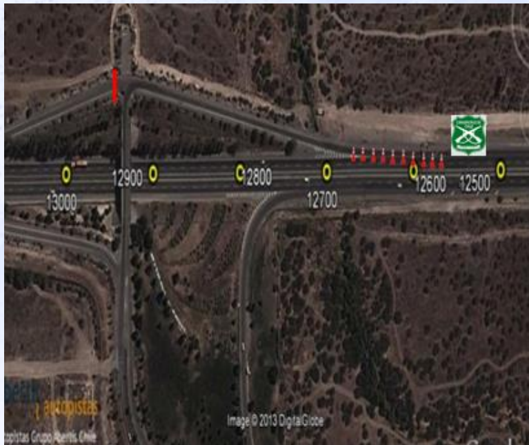
ZONA 4: Atraveso Ciudad de los Valles