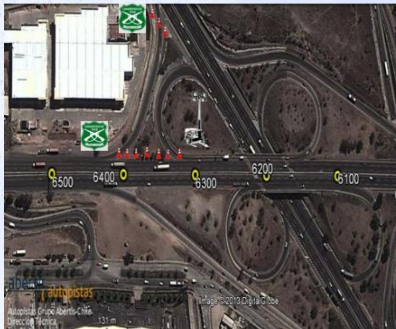
ZONA 1: Enlace Américo Vespucio