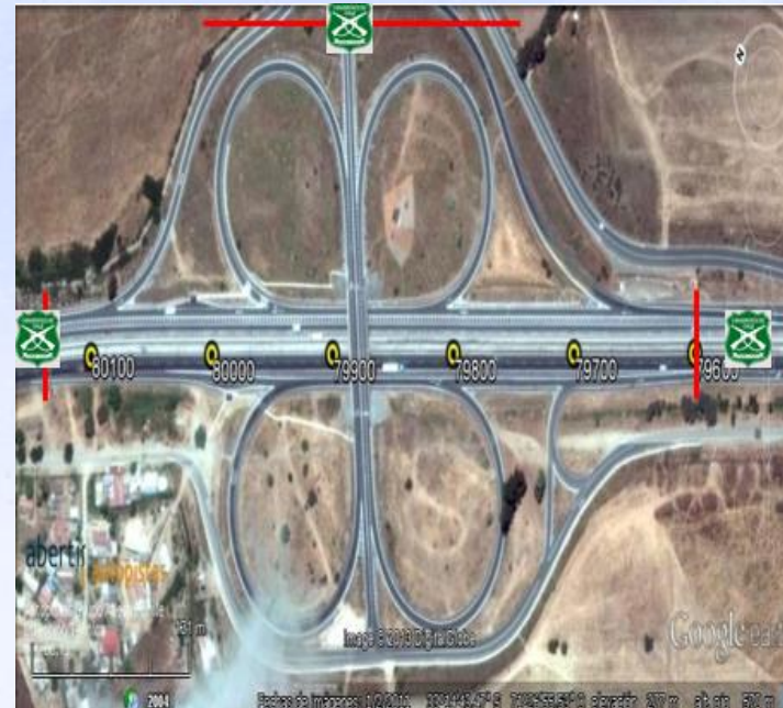
ZONA 11: Enlace Lo Orozco