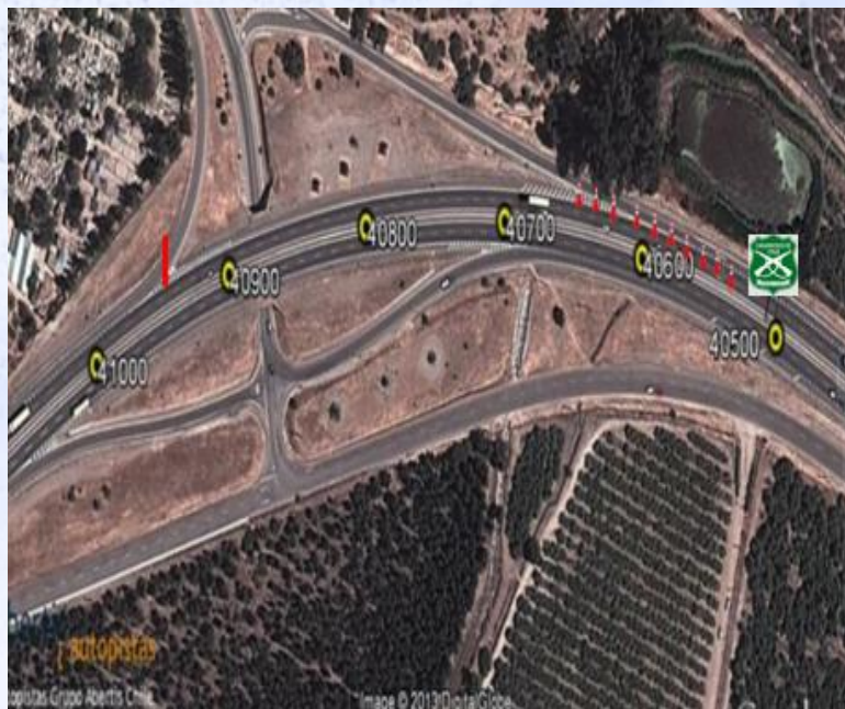
ZONA 7: Enlace Curacaví Oriente