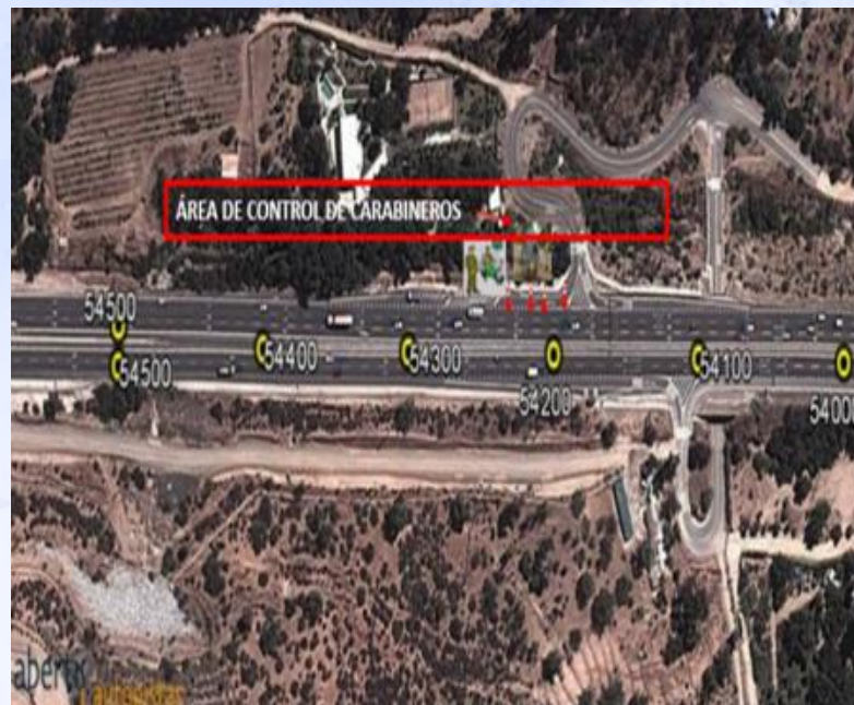
ZONA 8: Atraveso El Quillay