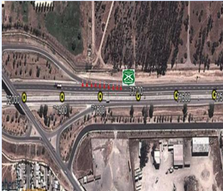
ZONA 10: Enlace Casablanca