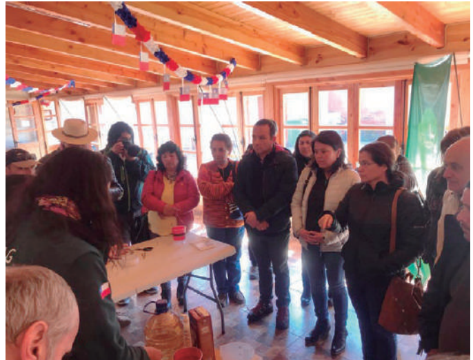
Foto 1: La capacitación es fundamental para un adecuado manejo de la plaga.

Debe tenerse en cuenta que ninguna trampa disponible actualmente en Chile es específica para Drosophila suzukii , por lo tanto dentro de la trampa habrá otras especies de drosofilidos y posiblemente muchas otras especies de insectos.