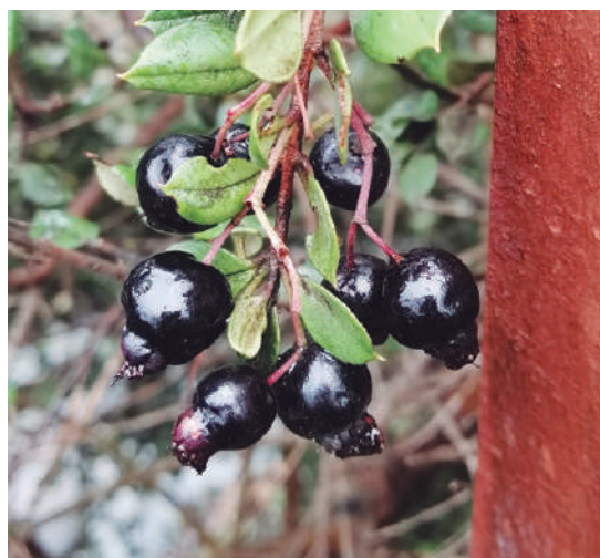
Foto 6: Algunas frutas nativas también son usadas por la plaga para reproducirse.