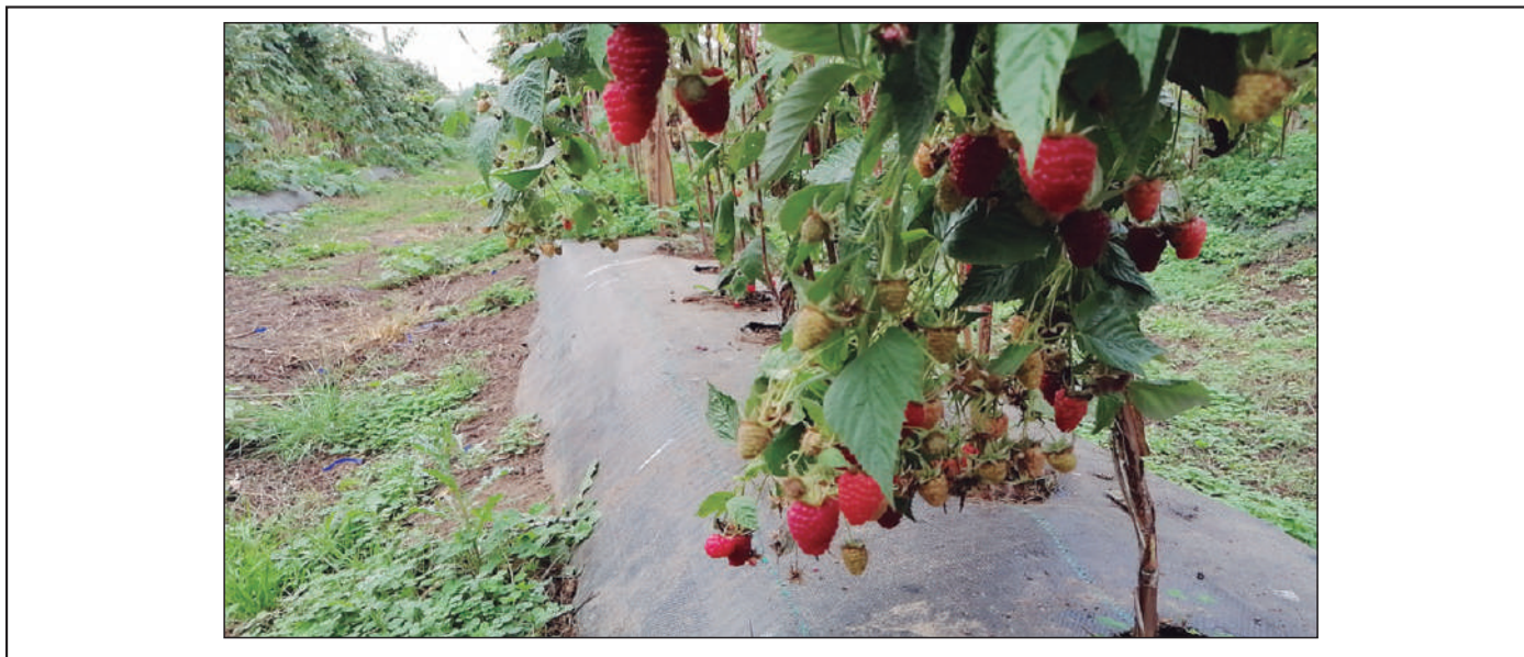
Foto 7. Un paquete tecnológico moderno es la mejor herramienta contra D. suzukii e implica un cambio cultural profundo en la forma de cultivar berries en Chile.

Como conclusión, se debe enfatizar que la base del manejo de la mosca de alas manchadas en nuestro país es el control cultural y que el control biológico (cuando esté disponible) y el control químico estarán limitados en su eficacia si los manejos culturales no se implementan de forma adecuada.