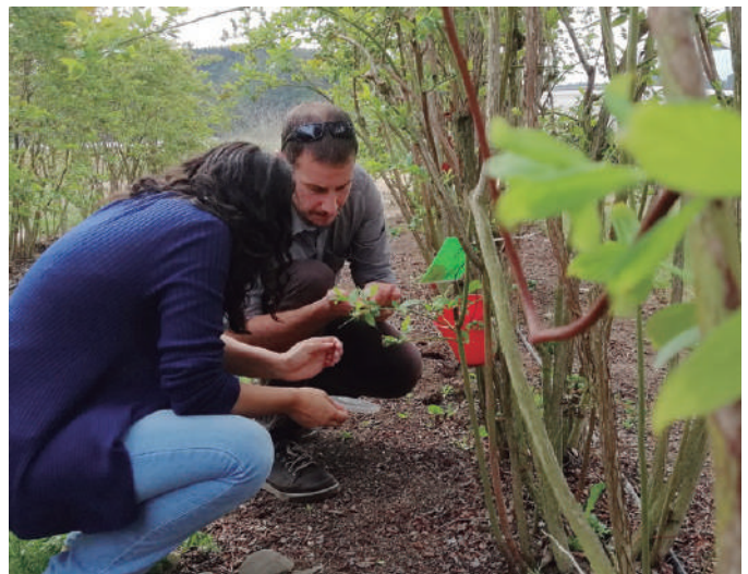
Foto 2: La capacitación del personal en campo facilita la detección temprana de la plaga.