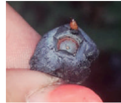
Presencia de pupas