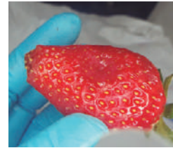
En frutillas y frambuesas, ablandamiento en la parte inferior de la polidrupa y presencia de jugo en el interior