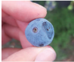
Pequeña depresión o zonas hundidas