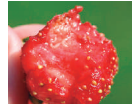
Presencia de larvas