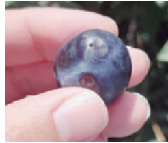
Exudación de gotas de jugo