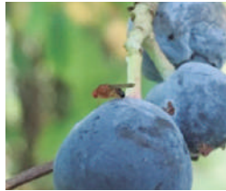
Presencia de drosophilos sobre la fruta