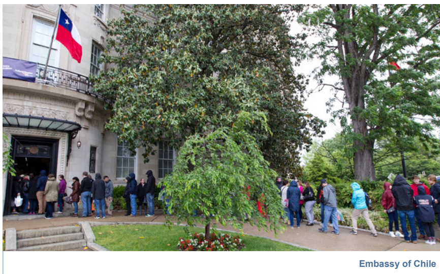
Embassy of Chile

SANTIAGO.- Este sábado, la residencia oficial de Chile en Estados Unidos participó del "DC Passport Tour Around The World", una jornada que ya es tradición en Washington y que consiste en que las embajadas abran sus puertas al público y muestren la cultura, sabores y tradiciones de cada país.