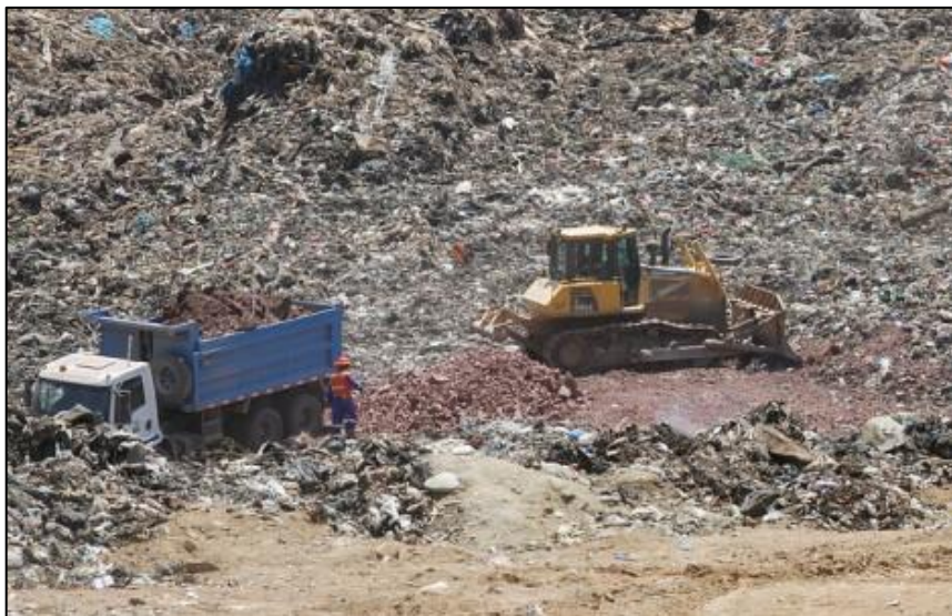
https://www.elmostrador.cl , 21 Oct. 2020